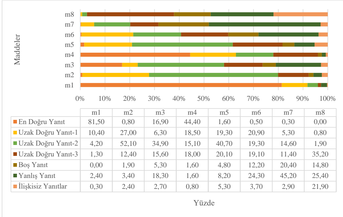
Şekil 2. Yüksek Başarılı Öğrencilerin Okuduğunu Anlama Başarı Testine Verdiği Yanıtların Dağılımları

Şekil 2'ye göre, öğrencilerin maddelere doğru yanıt verme oranı (en doğru yanıt ve uzak doğru yanıtlar) birinci düzeyde en yüksek (yaklaşık %95), dördüncü düzeyde ise (yaklaşık %30) en düşüktür. Tüm maddelere bir bütün olarak bakıldığında öğrencilerin doğru yanıtlardan en çok uzak doğru yanıtlarda, uzak doğru yanıt-1, uzak doğru yanıt-2 ve uzak doğru yanıt-3 kategorilerinde toplanmışlardır. En düşük doğru yanıt verilme oranları üçüncü ve dördüncü okuduğunu anlama düzeylerindedir. Yüksek başarılı öğrencilerin, üçüncü ve dördüncü düzey maddelerdeki yanıtları ise yanlış yanıtlarda toplanmıştır.